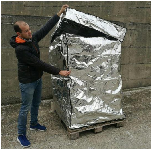
Art: TD 001

El sistema de funcionamiento es simple: si las temperaturas externas son rigidas, las cubiertas termicas para pallets no dejan que la mercancia se pueda congelar. Al contrario, con altas temperaturas, la pelicula rechaza las radiaciones IR y mantiene la carga a temperatura optima para todo el tiempo de transito.