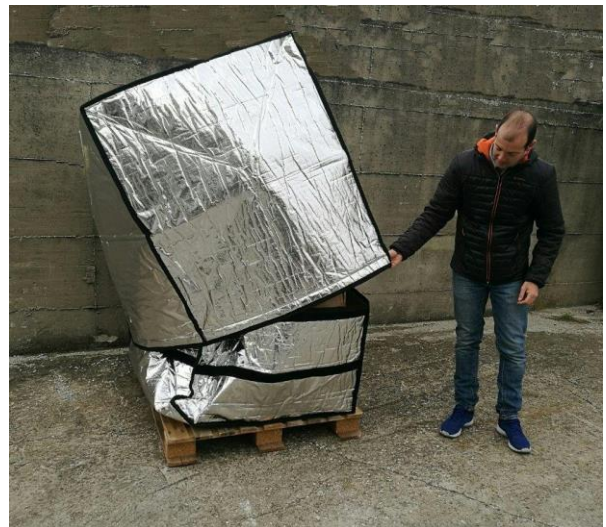
Art: TD 005